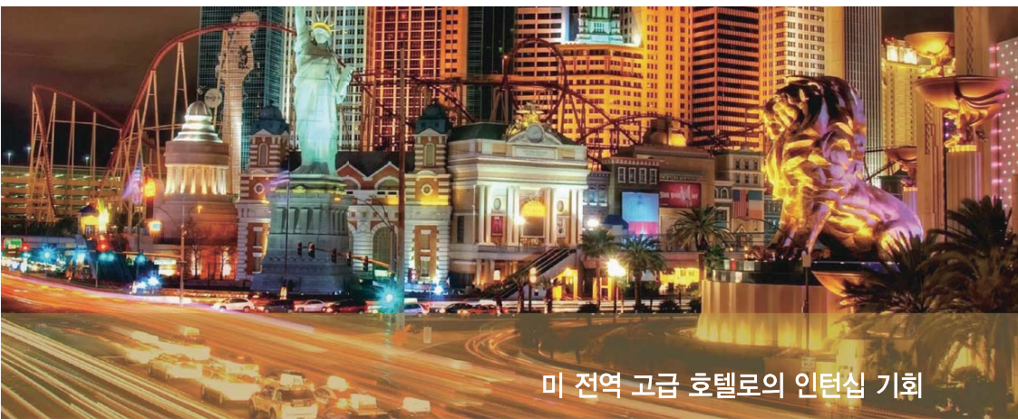
미 전역 고급 호텔의 인턴십 기회