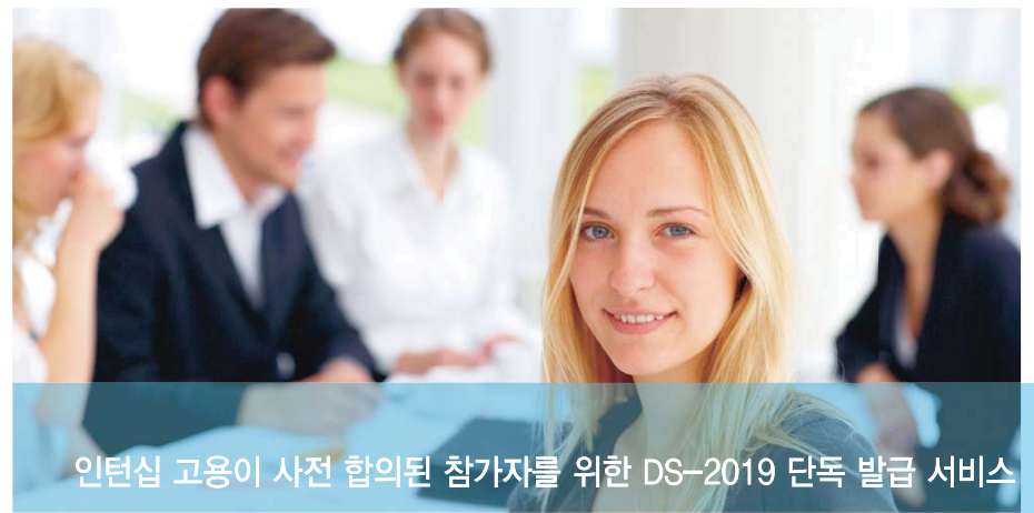
인턴십 고용이 사전 합의된 참가자를 위한 DS-2019 단독 발급 서비스